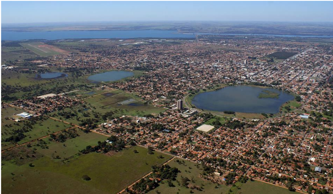
Figura 1: Vista aérea da cidade de Três Lagoas