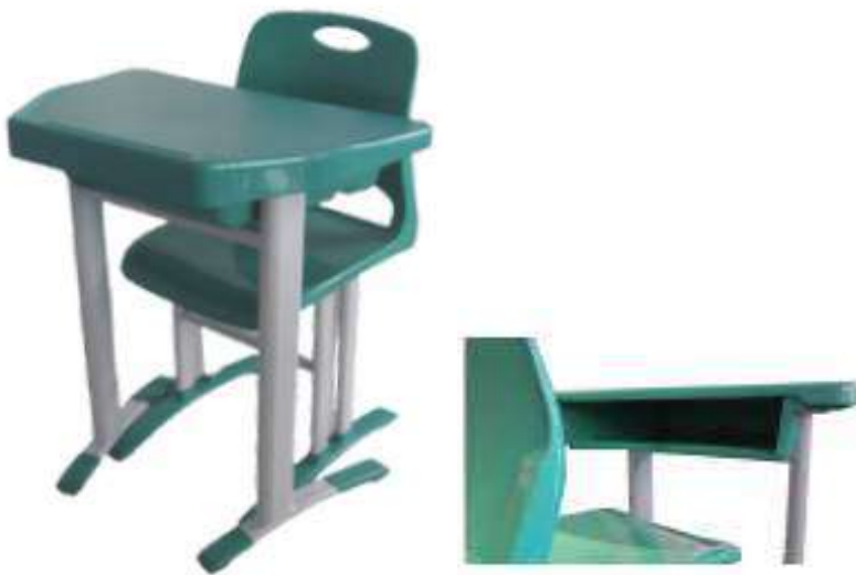
Detalhe da mesa