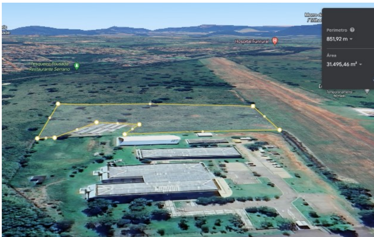
Imagem 2: Foto aérea do Campus AQ.

Considerando que há um planejamento para cercamento de toda área, se faz necessária a contratação de empresa para realização de serviços de roçagem.