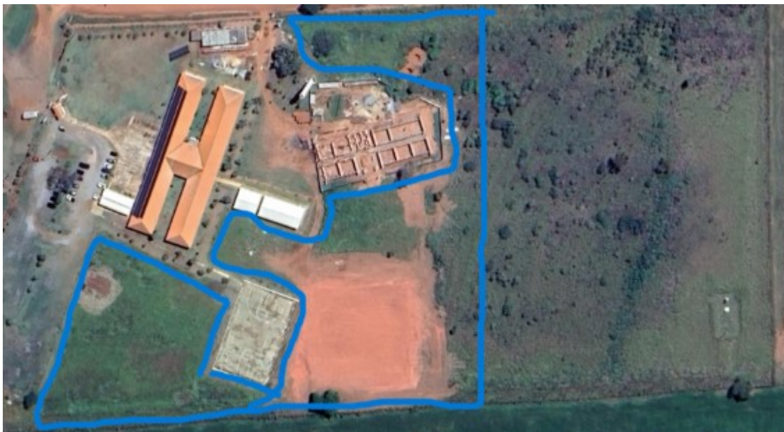
Imagem 8: Foto aérea do Campus JD - Google earth 2023