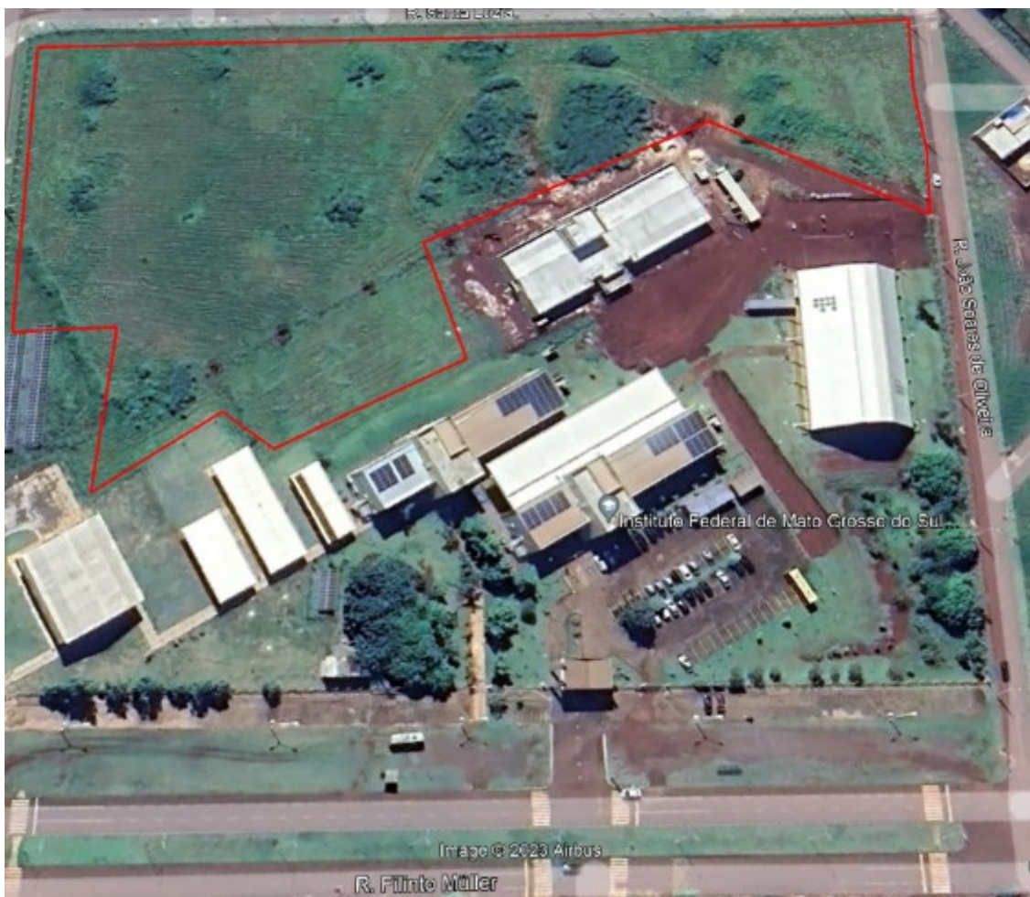
Imagem 7: Foto aérea do Campus DR - Google earth 2023 - com a área de roçada destacada na cor vermelha

Entendemos que a administração tem condições de arcar com os custos de manutenção, e que devido às dificuldades encontradas no que diz respeito à parceria junto à prefeitura, solicitamos que seja implementada a presente contratação.