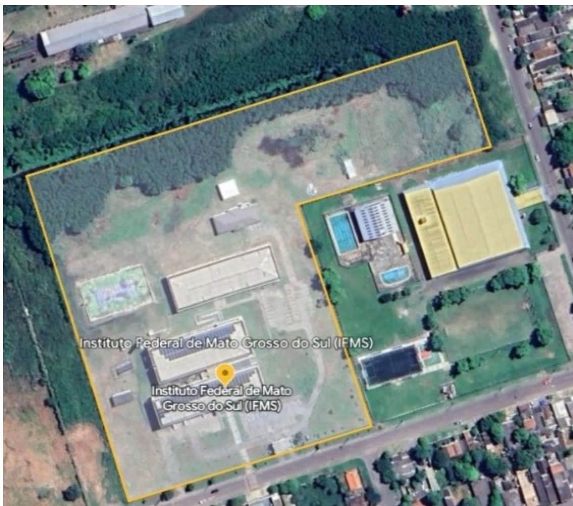
Imagem 6: Foto aérea do Campus CB