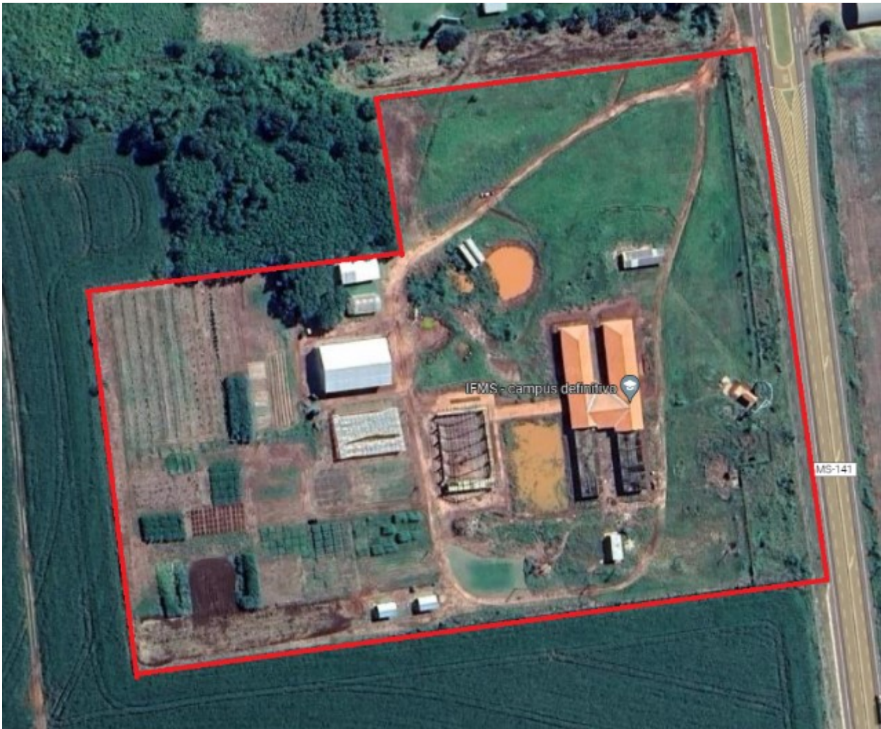
Imagem 10: Foto aérea do Campus NV

3) Fazenda escola com área de 43.000,00m 2 , composta por vegetação de pastagem e uma reserva. Não há área construída.