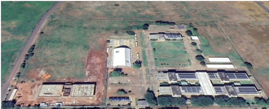
Imagem 4: Foto aérea do Campus CG

O campus hoje tem vigente o contrato 09/2019 para este serviço, contudo, mesmo havendo possibilidade de renovação, a empresa manifestou o desinteresse na renovação em virtude dos valores, mesmo após o reajuste. Sendo assim, há necessidade de nova contratação.