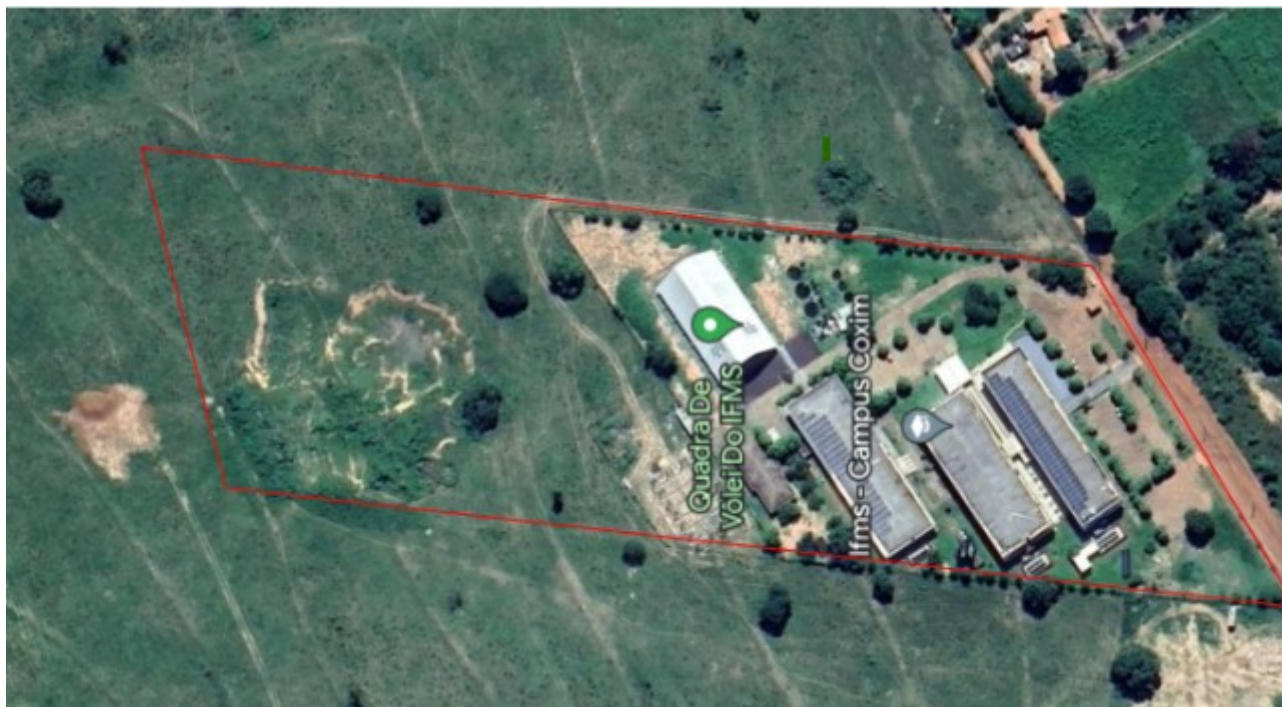
Imagem 1: Foto aérea do Campus CX.

Levando em consideração que o Campus Coxim tem uma extensão de 50.000m 2 , sendo que desse total 7.608,55m 2 correspondem à área predial construída até o momento e 4.173,49m 2 à área do estacionamento (paver/calçamento), o restante do terreno encontra-se coberto por vegetação nativa ou grama, inclusive, arbustos e árvores, demandando a manutenção periódica, como pode ser visualizado na imagem ilustrativa a seguir: