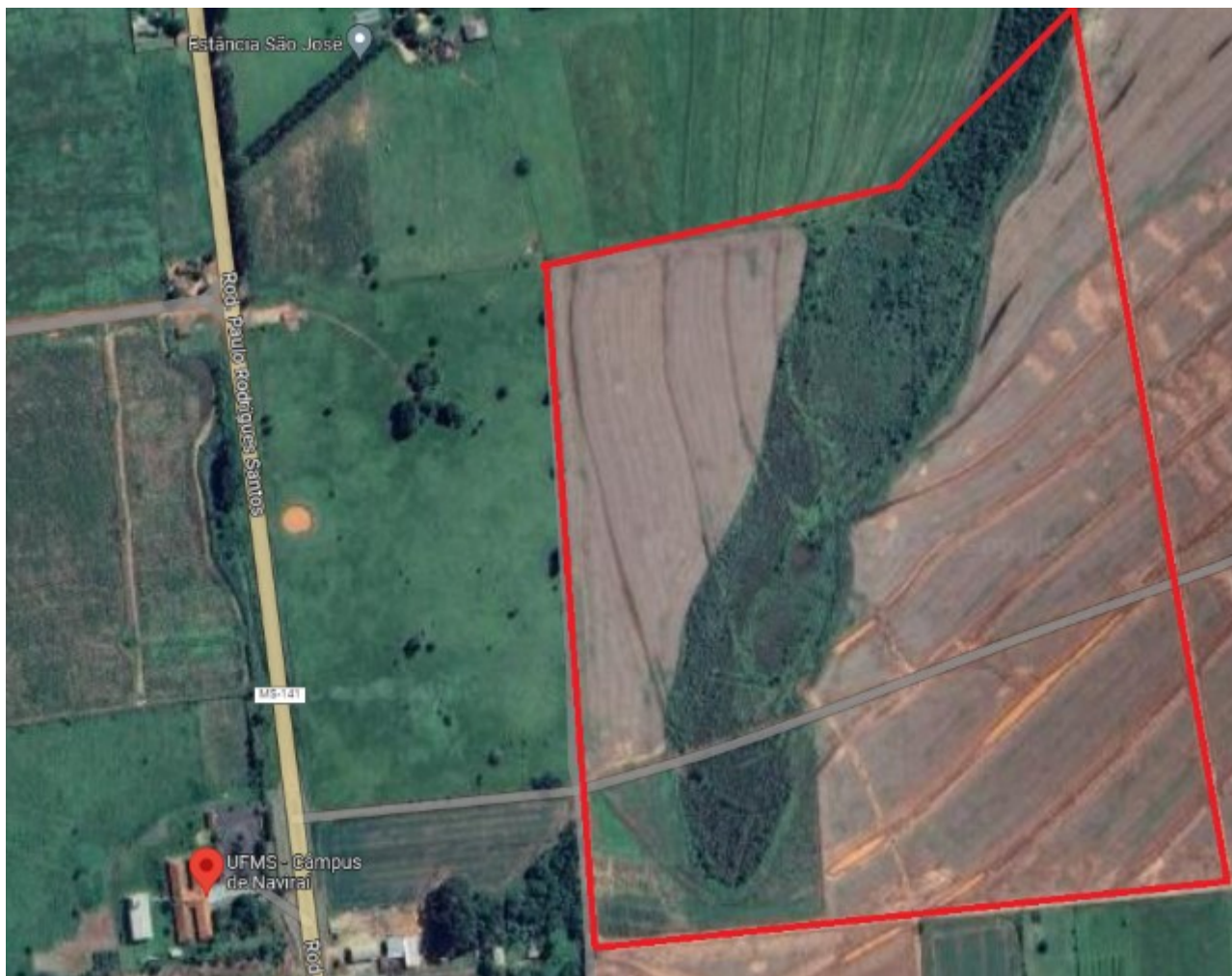
Imagem 11: Foto aérea do Campus NV

A contratação dos serviços nos três espaços do Campus , justifica-se pela necessidade de execução de capina, roçagem de vegetação e gramado, gradeação, aceiro e poda de árvores/arbustos nas áreas não construídas.