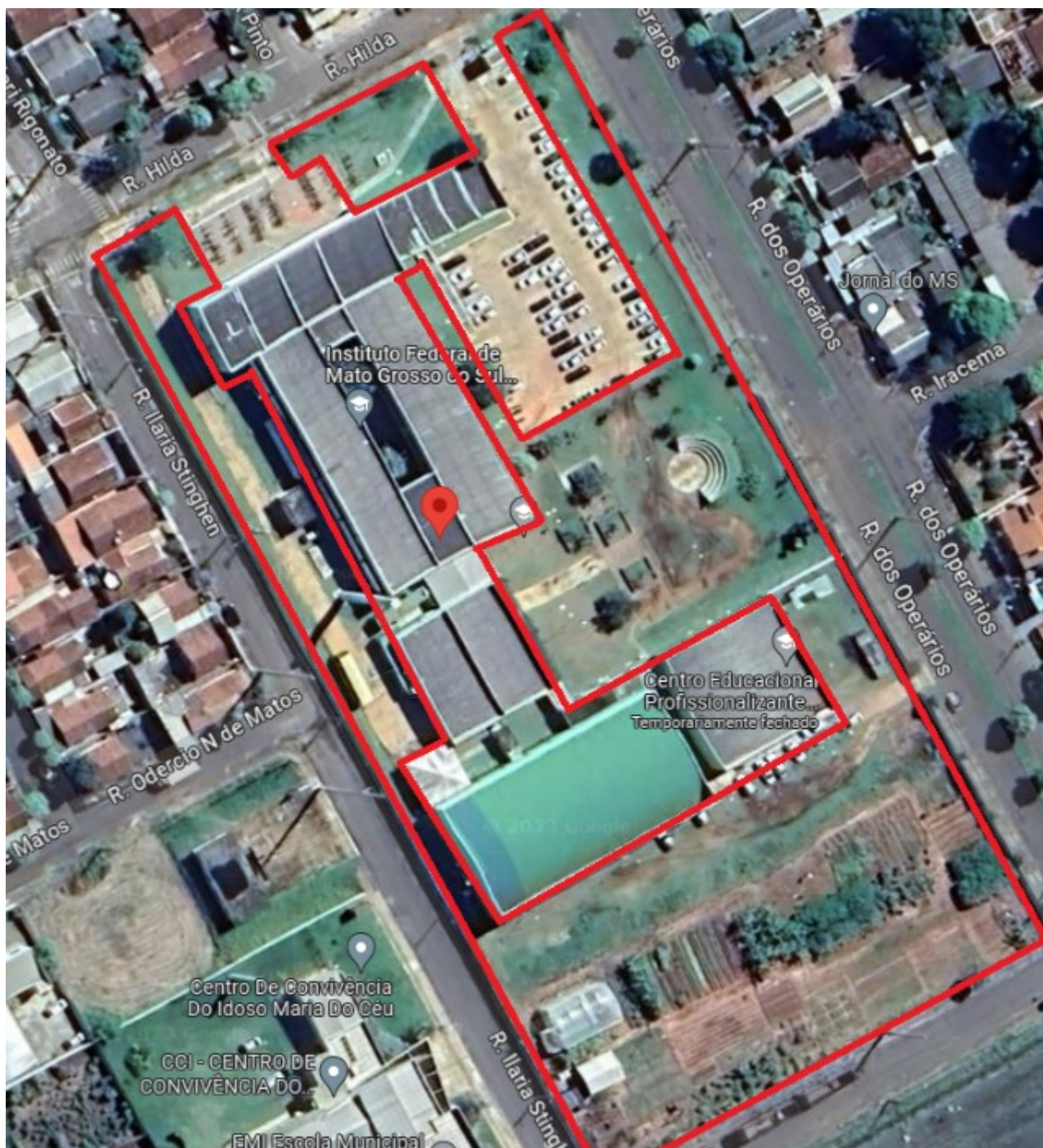
Imagem 9: Foto aérea do Campus NV - Google earth 2023

2) Sede definitiva cuja área é de 7.000,00m 2 , onde há construído 1 bloco H, 1 sala modular, 1 quadra poliesportiva, 1 barracão, 1 estufa e 1 casa de defensivos, somando um total aproximado de 3.000,00m 2 . Está no local também 2 containers. Há área gramada, mato e alguns arbustos.