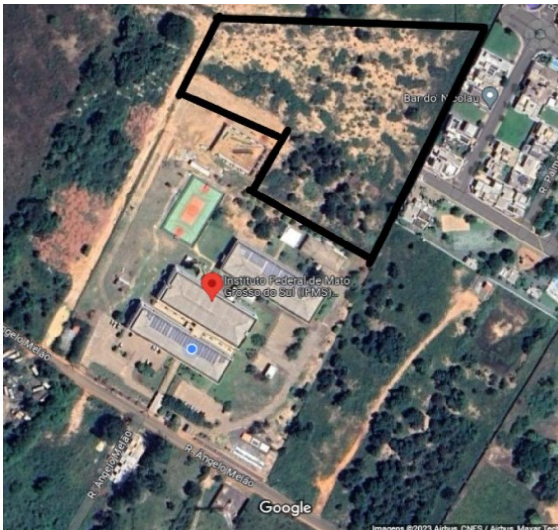
Imagem 12: Foto aérea do Campus TL - Google earth 2023

Os serviços mais importantes para esta contratação, no que se refere ao Campus Três Lagoas, dizem respeito à roçada, capina e aceiros em um espaço localizado atrás do último bloco, próximo ao ginásio poliesportivo, previsto para ser concluído no segundo semestre deste ano. Esta grande área é composta por "Mato" e arbustos, dificultando o trabalho das equipes de segurança e monitoramento, já que a vegetação alta favorece a ação de criminosos.