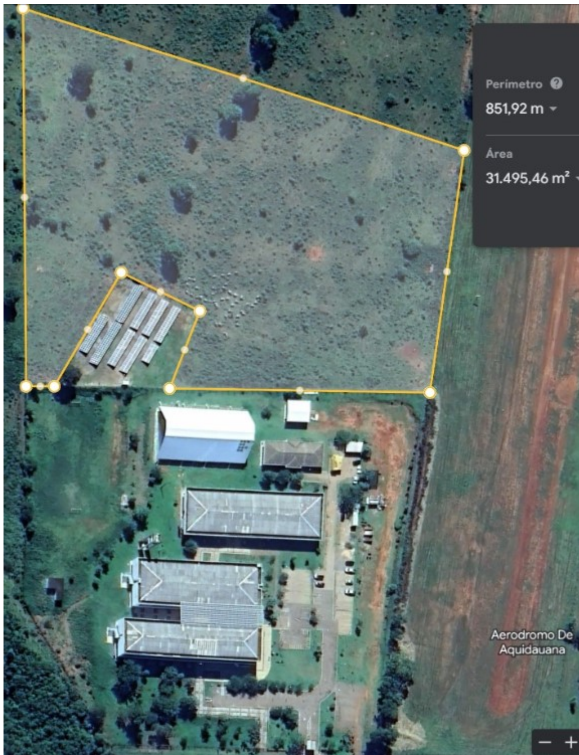
Imagem 3: Foto aérea do Campus AQ.