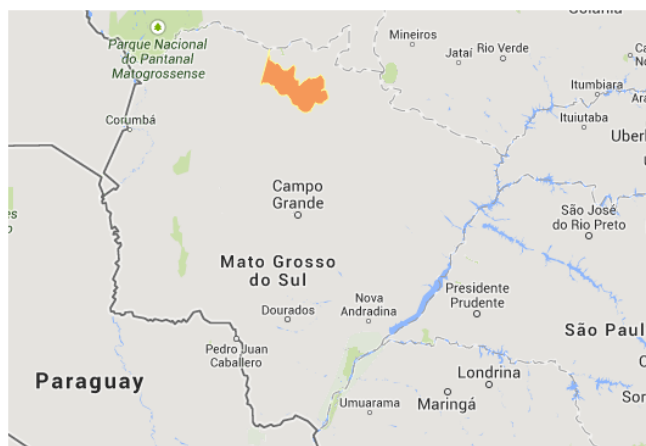
Figura 2. Localização do município de Coxim – MS.

O município de Coxim localiza-se na borda setentrional da Bacia do Alto Paraguai, região do Alto Taquari, norte do Estado do Mato Grosso do Sul, distante 250 km da Capital Campo Grande. O município possui 32.159 habitantes, segundo o IBGE (2010), com população estimada de 33.045 habitantes para o ano de 2014.