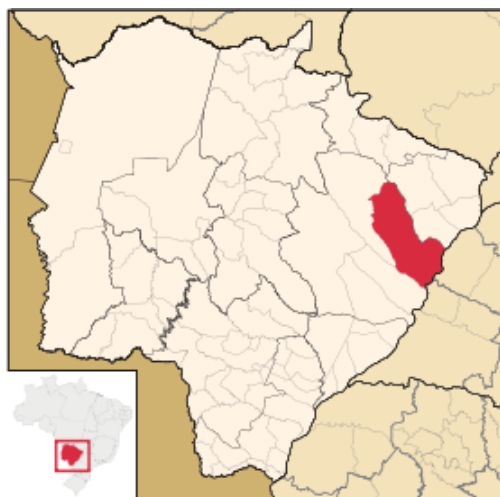
Figura 1: Localização geográfica de Três Lagoas

imprescindível a criação de um curso superior tecnológico para atender as demandas do município de Três Lagoas, com grandes possibilidades de inserção e qualificação da população nos novos mercados de trabalho.