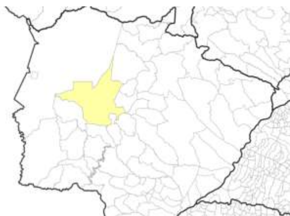
Figura 2 – Localização do município de Aquidauana.

O Quadro 2 exibe os quantitativos de estabelecimentos industriais por ramos de atividade do município de Aquidauana. Com um razoável desenvolvimento comercial, Aquidauana dispõe de variados estabelecimentos: em 2010 foram registrados 172 estabelecimentos filiados à Associação Comercial Empresarial de Aquidauana (ACEA). Vários grupos e redes empresariais participam do mercado aquidauanense, possuindo 56 estabelecimentos industriais de acordo com dados da Secretaria de Estado de Meio Ambiente, Desenvolvimento Econômico, Produção e Agricultura Familiar (SEMAGRO). (MATO GROSSO DO SUL, 2018)