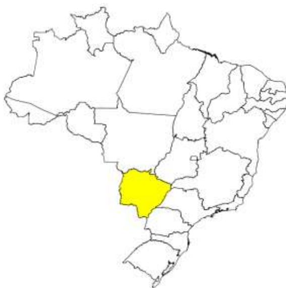
Figura 1 - Localização do Estado de Mato Grosso do Sul.

Localizado na região centro-oeste, Mato Grosso do Sul possui uma área de 357.124 km 2 , correspondendo a 4,19% do total brasileiro. De acordo com o Censo Demográfico 2010 do IBGE, o Estado possui 79 municípios e uma população de 2.449.024 pessoas.