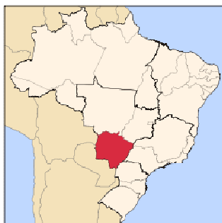
Figura 1 - Localização de Mato Grosso do Sul

Conforme Censo Demográfico de 2010, a população residente no estado correspondia a 2.449.024 habitantes, sendo 2.097.238 pessoas residentes na área urbana e 351.786 na área rural 3 . Com uma área de 357.145,532 km 2 , composta por 4 mesorregiões, 11 microrregiões e 79 municípios o estado é ligeiramente maior que a Alemanha.