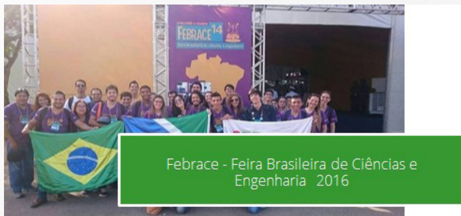
Imagem 1: Febrace- Feira Brasileira de Ciência e Engenharia 2016