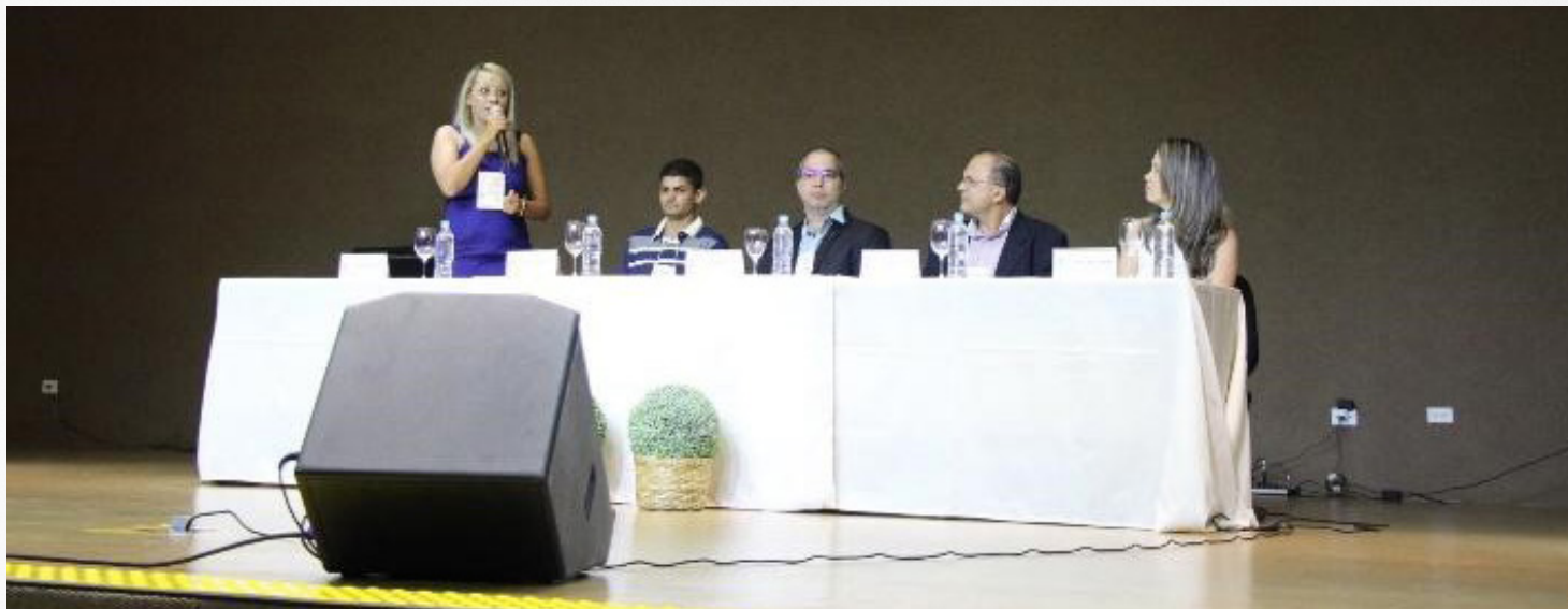
Imagem 4: Abertura FESTART Fonte: Arquivo pessoal servidores, 2018.