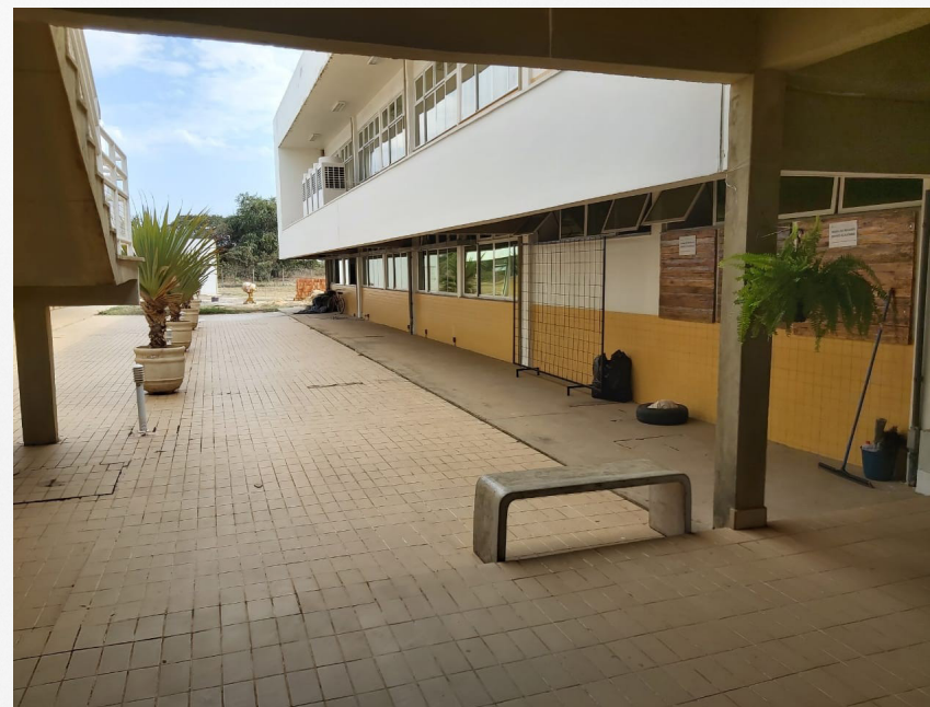
Imagens: 15, 16 e 17: Arborização do Ambiente escolar