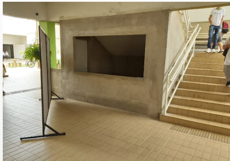
Imagens 11 e 12: Fechamento da escada para a criação da reprografia para os alunos e almoxarifado para armazenamento de materiais do campus.