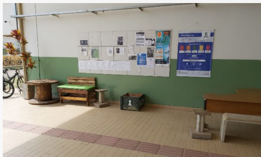
Imagem 13: Criação de bancos de palhetes para alunos e servidores do campus.