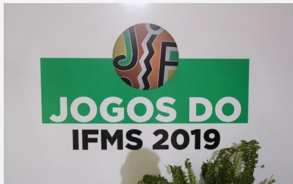
Imagens 5 e 6: Jogos do Instituto Federal de MS (JIFMS) sediado em Três Lagoas.