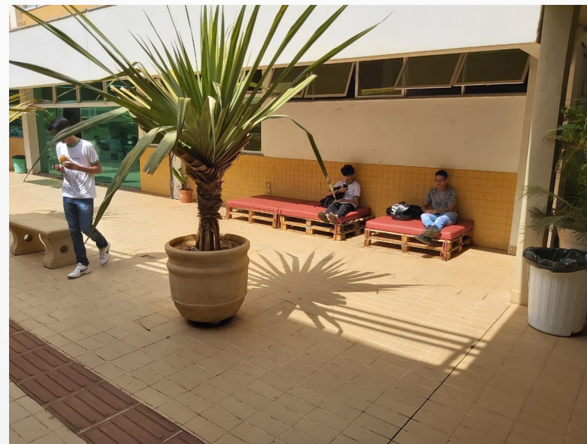
Imagem 8: Puf's ecologicamente criado para os alunos.