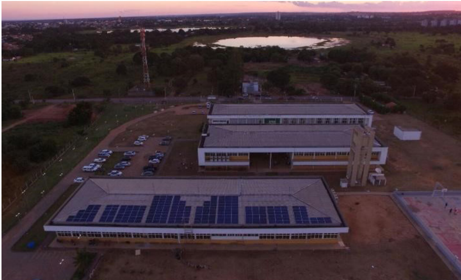
Imagem 2: Usina Fotovoltaica instalada no teto do Bloco C.