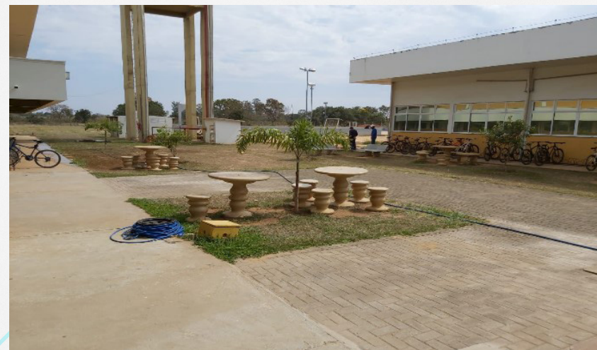
Imagens 9 e 10: Bancos de concretos adquiridos para os estudantes.