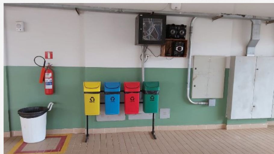
Imagem 14 Aquisição de som para uso dos alunos durante intervalo e lixeiras para a coleta seletiva