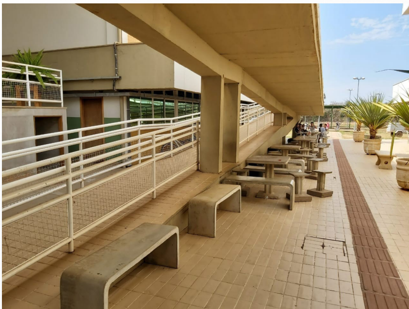
Imagem 7: Bancos de Concretos para os alunos e servidores.