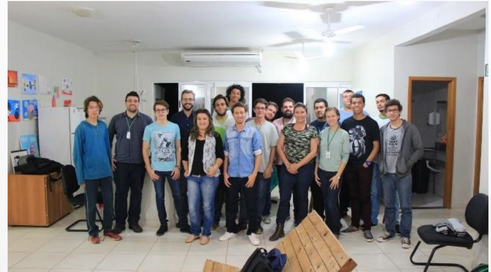
Imagem 3: Inauguração da TecnOLF – Campus Três Lagoas com os primeiros projetos pré-incubados.